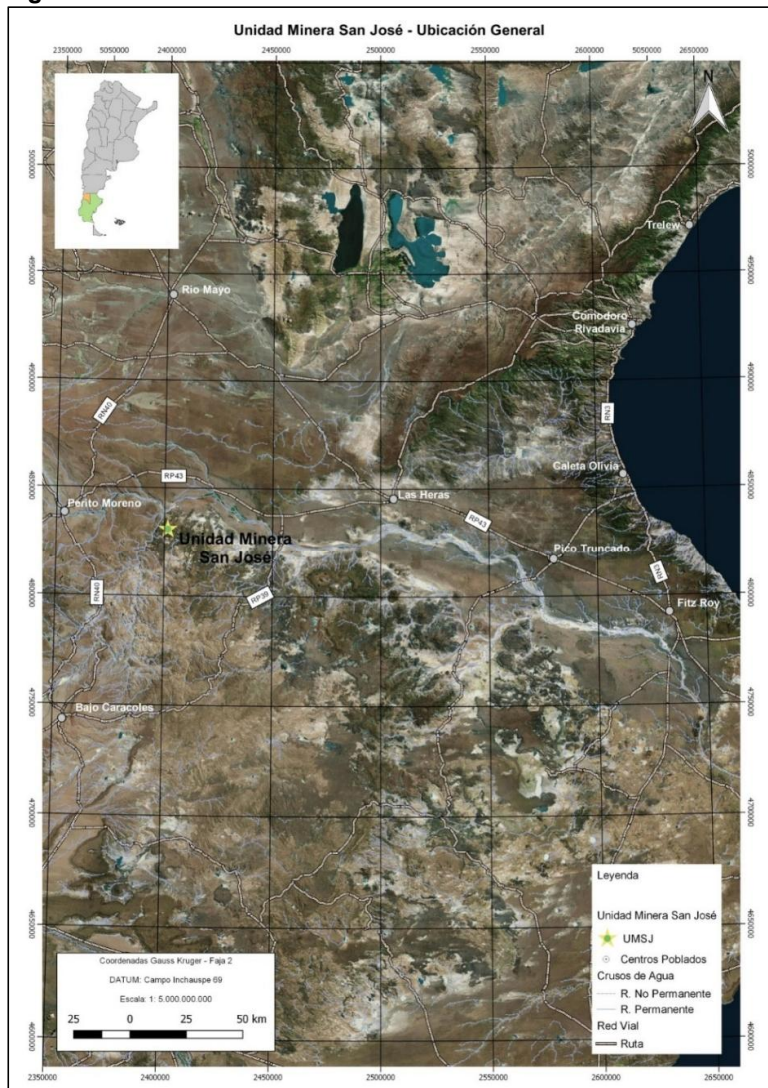
Figura 1.1. Ubicación General – Unidad Minera San José

La compilación de la información, confección y edición del presente informe ha sido desarrollada por los profesionales de GT, apoyados a su vez por el departamento de Medio Ambiente de UMSJ.